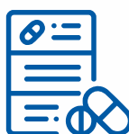
ЛІКИ, ЛІКАРСЬКІ ПРЕПАРАТИ