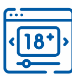
ПРЕДМЕТИ НЕПРИСТОЙНОГО ХАРАКТЕРУ