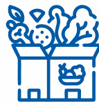
ХАРЧОВІ ПРОДУКТИ ФАБРИЧНО ЗАПАКОВАНІ (ДО 10 КГ)