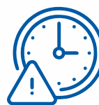
ТОВАРИ, ЩО ШВИДКО ПСУЮТЬСЯ