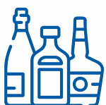
АКЦИЗНИЙ АЛКОГОЛЬ ТА ТЮТЮНОВІ ВИРОБИ