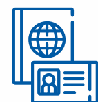
ДОКУМЕНТИ, ЩО ПІДТВЕРДЖУЮТЬ ОСОБУ