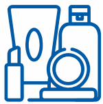
КОСМЕТИКА ТА РІДИНИ