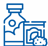
СУШЕНИЙ ТЮТЮН ТА СПИРТ