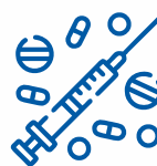
НАРКОТИКИ ТА ПСИХОТРОПНІ РЕЧОВИНИ