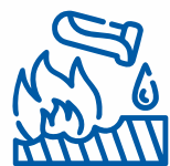
ЛЕГКОЗАЙМИСТІ АБО КОРОЗИЙНІ РЕЧОВИНИ