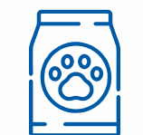
КОРМ ДЛЯ ТВАРИН