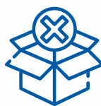
ЗАБОРОНЕНІ В КРАЇНІ ПОХОДЖЕННЯ, ТРАНЗИТУ ЧИ ПРИЗНАЧЕННЯ