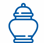
ПРАХ ЧИ ОСТАТКИ ПОМЕРЛИХ