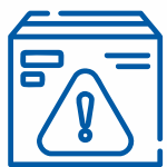
НЕБЕЗПЕЧНІ ПРЕДМЕТИ ДЛЯ ЛЮДЕЙ ЧИ ПОСИЛОК