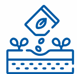
НАСІННЯ ТА САДЖАНЦІ